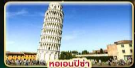
หออนปีซ่า