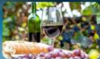
พิเศษ!! ซิมไวน์ท้องถิ่น