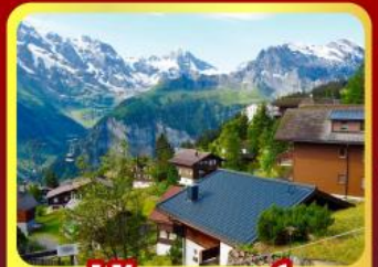
หมู่บ้านเมอร์ส