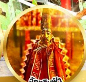
ขอพรเสริมโชคลาภในธุรกิจ และการเงิน