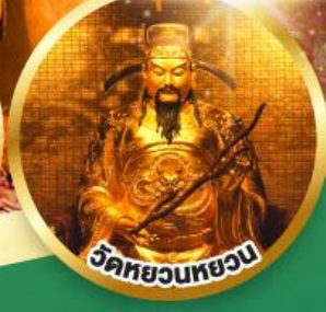
ขอพรเรื่องสุขภาพ, โชคลาภ ความสำเร็จก้าวหน้า

เมนูพิเศษ! ต้มช่าฮ่องกง, บุฟเฟ่ต์ชาบูสไตล์ฮ่องกง, ห่านย่าง