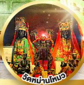
ขอพรเรื่องการศึกษา, การงาน สติปัญญาและความกล้าหาญ