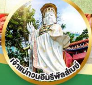
ขอพรรับพลังงานดี เสริมพลังฮวงจุ้ย