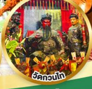
ขอพรเทพเจ้ากวนอู เงินทอง, ธุรกิจมั่นคง