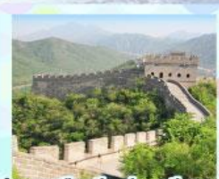
กำแพงเมืองจีน ด้านจวิยงกวน