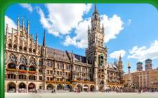
จัตุรัสมาเรียนพลัทซ์ มิวนิก