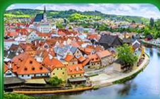
เมืองมรดกโลก เซสท์ครุมลอฟ