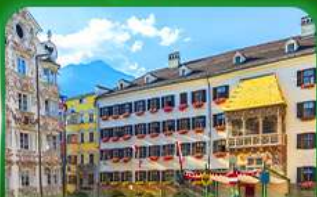
หลังคาทองคำ อินส์บรุค