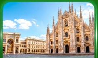
มหาวิหารดูโอโมแห่งมิลาน