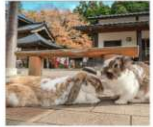
หมู่บ้านกระต่ายดางะ