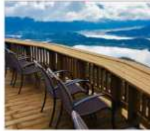
มิกะตะ 5 ทะเลสาบ