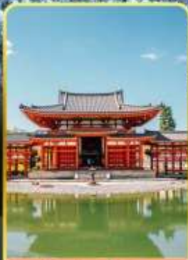
วัดเมียวโดอิน