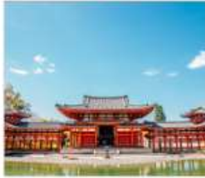
วัดเมียวโดอินมรดกโลก