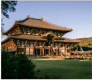
วัดโทไดจิ นารา