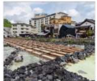
ชมยูมาทาเกะดุสึทสึ