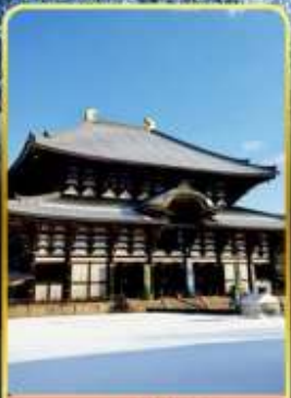
นาราโกไดจิ

พิเศษพักในเมืองคุสัทสึออนเซ็นพร้อมชมยูบาคาเกะ