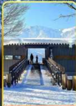
ฮาคุบะอิวาตาคะ