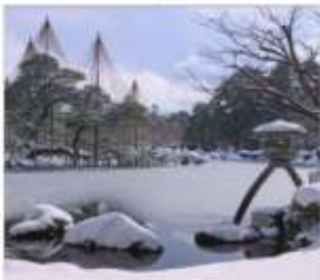
สวนเดนมะรุคเซ็น