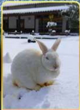
หมู่บ้านกระต่ายคางะ