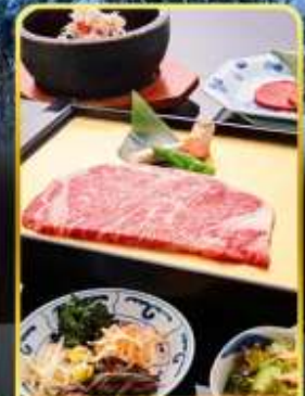
ปิ้งย่าง ROKKASEN