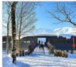
นั่งกระเช้าซาคุมะ