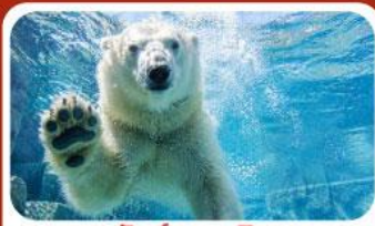
สวนสัตว์อาซาฮิยามะ