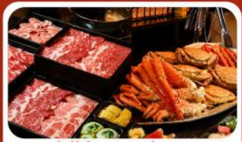
บุฟเฟ่ต์ซาบู ซาบู 3 ชนิด