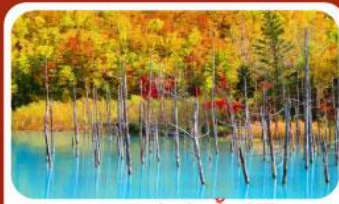
บลูพอนด์ (บ่อน้ำสีฟ้า)