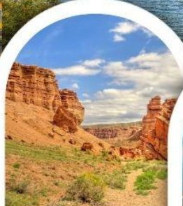
ชาร์นแคนยอน