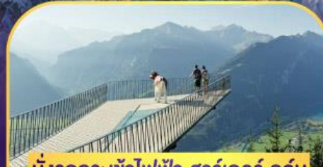
นั่งรถกระเช้าไฟฟ้า ชาร์เตอร์ ดูล์ม