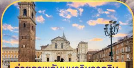
ถ่ายภาพกับมหาวิหารตูริน