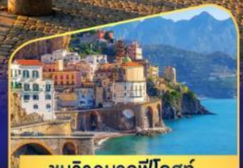
ชมวิวมอลฟีโคสก์