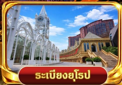
ระเบียงยุโรป