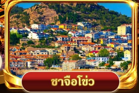
ซาจื่อโซ่ว