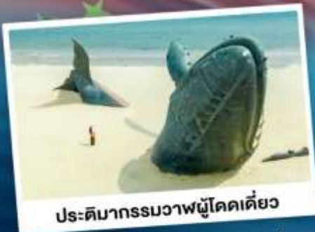
ประติมากรรมวาฬโศดเดี่ยว

เที่ยวเมืองชายทะเลโอปิตีตี ซิงเต่า - ต้าเหลียน - ฉะเจียงไต้