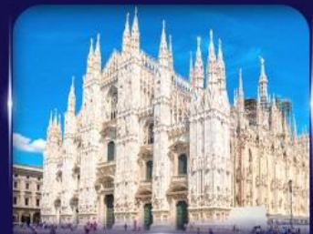
เซนต์มาร์กาเรต มิลาน