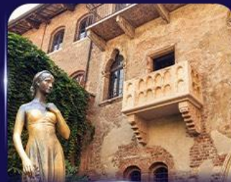
เขื่อนบ้านจูเลียต เวโรนา