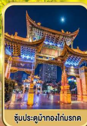
ซุ้มประตูม้าทองไถ่มรดก