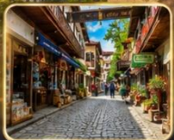
เดินเล่นย่านเมืองเก่าบรรยากาศย้อนยุค