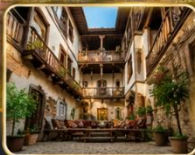
บ้านเรือนสไตล์ออตโตมัน อายุกว่า 200 ปี

เมืองท่องเที่ยวที่มีชื่อเสียงของจังหวัดการาบิก (Karabük) ในปี 1994 เมืองซาฟรานโบลู ได้ถูกองค์การยูเนสโกให้เป็นมรดกโลกทางด้านวัฒนธรรม