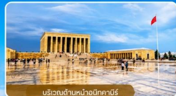
บริเวณด้านหน้าอนิคาบิร์