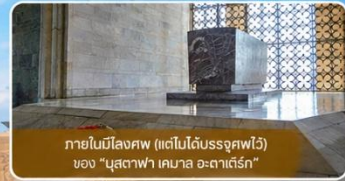
ภายในโถงศพ (แต่ไม่ได้รับอนุญาต) ของ "มุสตาฟา เคมาล อะตาเติร์ก"