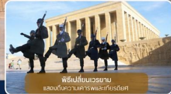
พิธีเปลี่ยนเวรยาม แสดงถึงความเคารพและเกียรติยศ