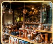
เลือกซื้อของฝากงานหัตถกรรมพื้นเมือง

สัมผัสเสน่ห์แห่งอดีตในเมืองที่เวลาเดินช้าลง กับสถาปัตยกรรมอันงดงาม วัฒนธรรมที่ยังคงมีชีวิต และความอบอุ่นจากผู้คน