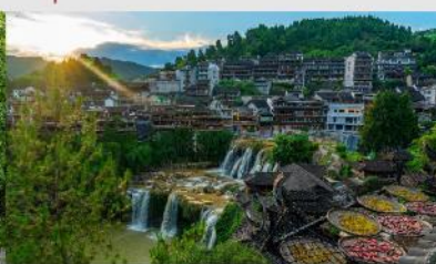
หมู่บ้านโบราณฝูหรงเจิ้น

*ทางบริษัทฯ ขอสงวนสิทธิ์ในการสลับโปรแกรมทัวร์ตามความเหมาะสมขึ้นอยู่กับสถานการณ์หน้างาน โดยคำนึงถึงผลประโยชน์ของลูกค้าเป็นสำคัญ