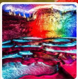
ถ้ำเก้าเทพ