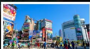
ซ้อปิ้งซีเหมินตง