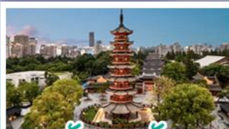
วัดเจกลงเซ้า