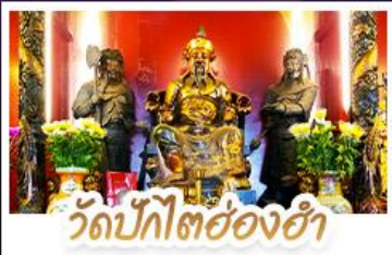
วัดปึกไค้อ่งฮ่า

นั่งกระเช้าแองปิงสักการะพระใหญ่เทียนถาน • ขอพรองค์เซกง โชคลาก การเงินและธุรกิจ เทพเจ้าปึกไค้อ่งฮ่า ขอพรเรื่องความสำเร็จในชีวิตและการทำงาน • วัดหวังต้าเซียน สักการะสิ่งศักดิ์สิทธิ์ เสริมมงคลชีวิต • เข้าแม่ทวนอิมอ่องฮ่า ขอเรื่องเงิน ทรัพย์สิน และความมั่งคั่ง • อิศระท่องเที่ยว 2 วัน เสือช้อปมิตรคิสมีย์แดนค์หรือช้อปบั้งจ๊อง