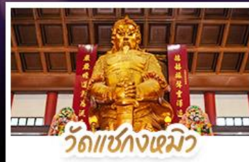
วัดเซกกงเมี้ยว