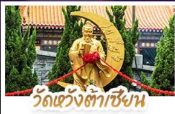
วัดเซว้งต้าเซียน