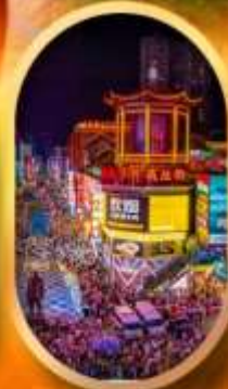
ถนนคนเดินซิงลู่