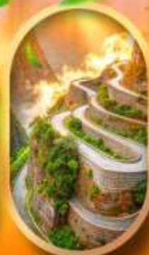
หุบเขาป้ายช้าง