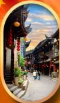
เมืองโบราณฟูหลงเจี้ยน