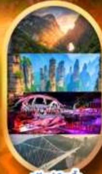
พรีเซนเลือกซื้อ Option เสริม