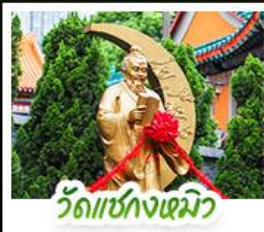
วัดเข่งหมิง