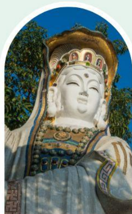
เจ้าแม่กวนอิม ธิพลสัย