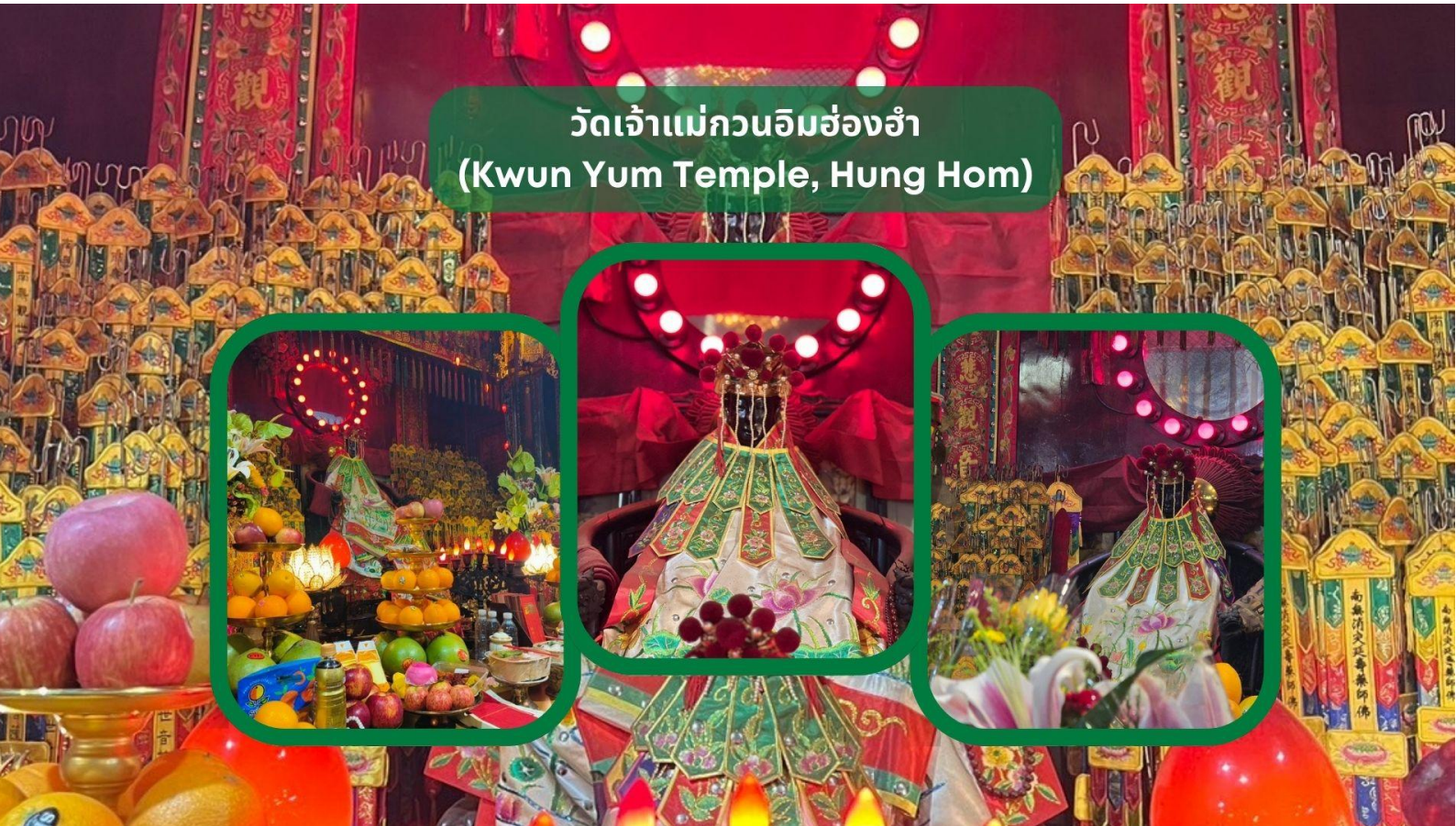
วัดเจ้าแม่กวนอิมฮ่องกง (Kwun Yum Temple, Hung Hom)

เช้า รับประทานอาหารเช้า ณ ภัตตาคาร บริการท่านด้วยเมนูติ่มซำฮ่องกง (มื้อที่ 3)