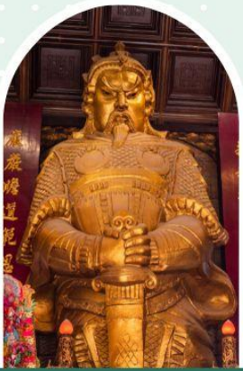
วัดเซกวง

"ไหว้พระ เสริมดวง เพิ่มสิริมงคลแก่ชีวิต"