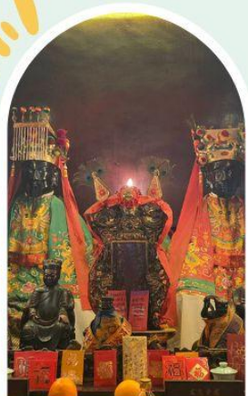
วัดหมิ่นโหมว