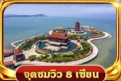
จุดชมวิว 8 เชียง