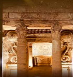
สุสานใต้ดินอเล็กซานเดรีย