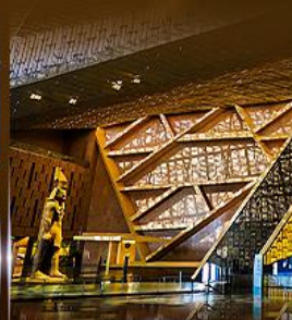
พิพิธภัณฑ์แกรนด์อียิปต์ (GEM)