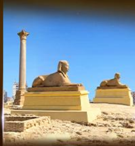
เสาสีบีนปอนเบย์