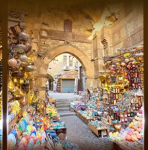
ตลาดงานเวอลาสี