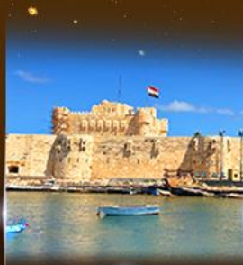
บึงปรามาร Quite Bay