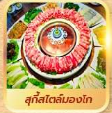
สุกีสไตล์มองโก