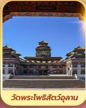
วัดพระโพธิสัตว์อูลาน