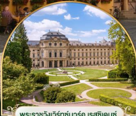
พระราชวังแวร์ซายส์ ฝรั่งเศส