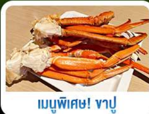
เมนูพิเศษ! ซาซิมิ