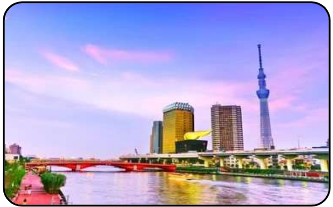
แม่น้ำซูมิดะ

สักการะ วัดมัตสึจิยามะโชเด็น หรือ “วัดหัวไชเท้า” ซึ่งเป็นวัดเก่าแก่ในย่านอาซากุสะ เป็นวัดเก่าแก่ในย่านอาซากุสะ กรุงโตเกียว ตั้งอยู่บนเนินเขาเล็ก ๆ ริมแม่น้ำซูมิดะ จุดเด่นคือเป็นวัดที่ขึ้นชื่อเรื่อง “ขอพรด้านการเงิน” โชคลาภ และความสำเร็จในธุรกิจ ส่วนไฮไลต์สำคัญของวัดนี้คือ ไคคอน หรือหัวไชเท้า สัญลักษณ์ศักดิ์สิทธิ์ คนที่นี้เชื่อว่าไคคอนช่วย “ชำระล้างสิ่งไม่ดี” และนำโชคลาภเข้ามา นักท่องเที่ยวมักนำไคคอนไปถวายเพื่อขอพร