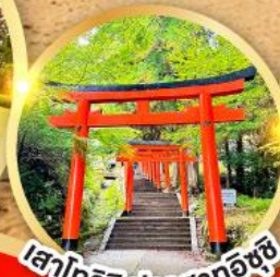
เสาโทริอิ ปราสาทอิซุชิ