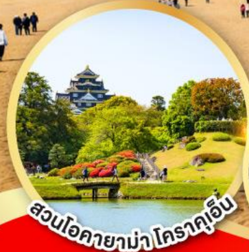
สวนโอคายาม่า โคราคูเอ็น