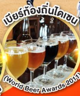
เบียร์ท้องถิ่นโดเซน (World Beer Awards 2011)

นั่งกระเช้าชมใบไม้เปลี่ยนสี ภูเขาโดเซน ฟูจิ แห่งทตโตริ