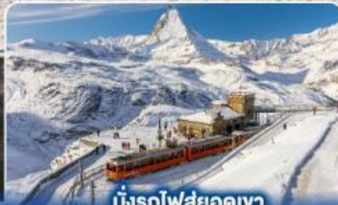
นั่งรถไฟสุดอลังการ กรอนเนอร์เกรต