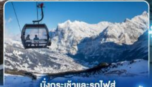
นั่งกระเช้าและรถไฟสุด อลังการจากเจนีวา