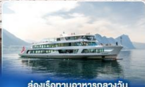
ล่องเรือทานอาหารกลางวัน ทะเลสาบลูเซิร์น