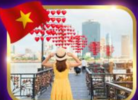
เชคอินสะพานแห่งความรัก