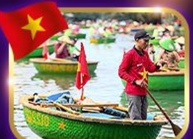
เรือกระด้ง หมู่บ้านกิมทาน