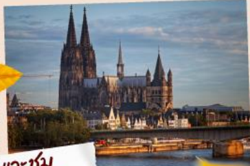
แวะชม มหาวิหารโคโลญ