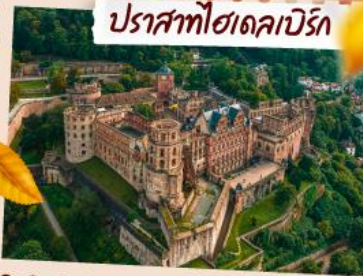
ปราสาทโฆเดอเปริก