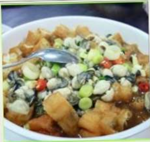
ถนนโบราณซือเฟิ่น