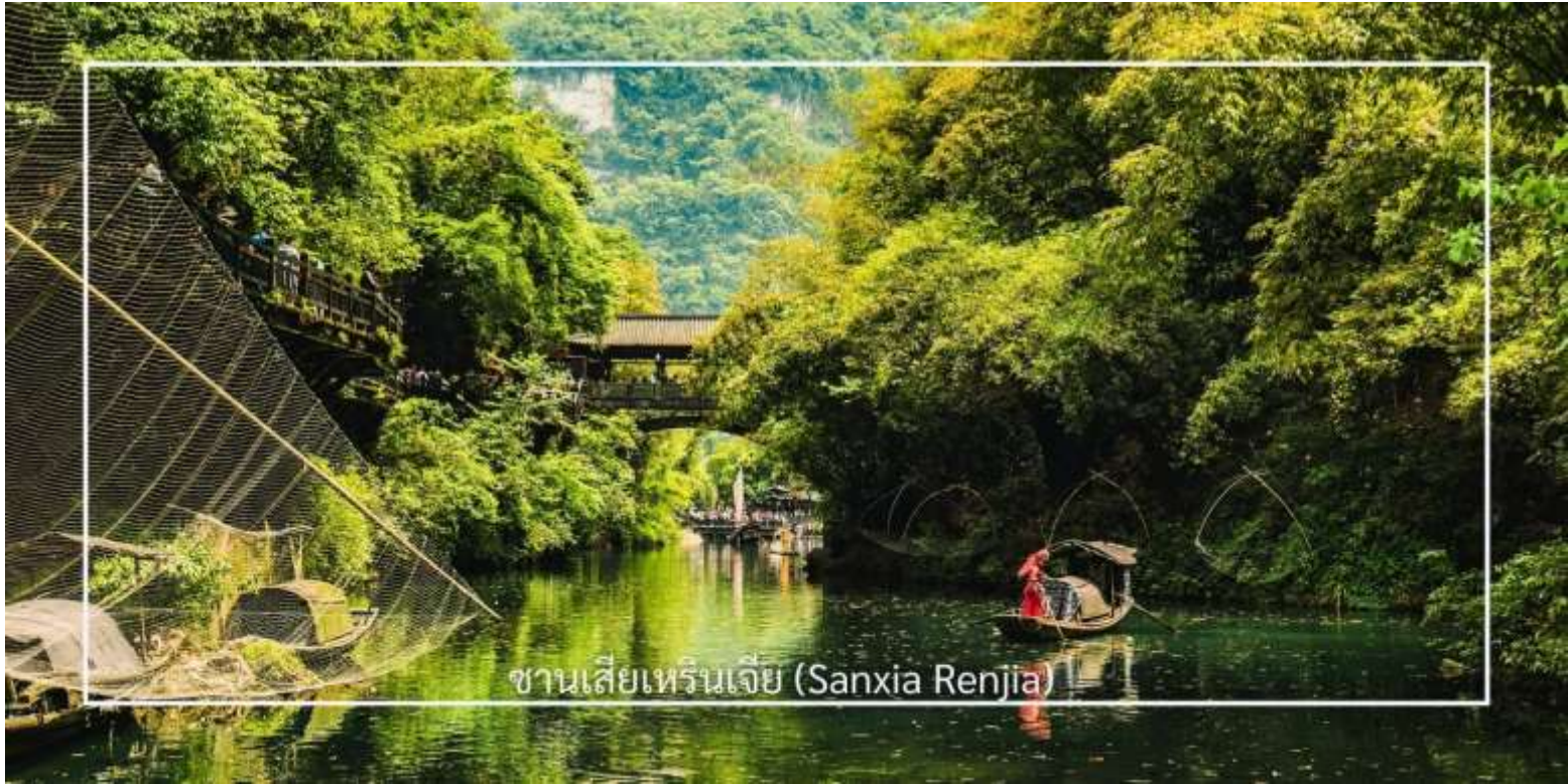
ซานเซียเหรินเจีย (Sanxia Renjia)

นำท่านสู่ หมู่บ้านซานเซียเหรินเจีย (Sanxia Renjia) (รวมล่องเรือ) สถานที่นี้เป็นที่รู้จักกันในชื่อ หมู่บ้านสามผา แหล่งท่องเที่ยวระดับ 5A ตั้งอยู่ในเขตหุบเขาสามผา ริมน้ำแยงซีเกียง โดดเด่นด้วยทัศนียภาพทางธรรมชาติอันงดงามของภูเขาหินผา สายน้ำ และหุบเขาที่โอบล้อมกันอย่างกลมกลืน สถานที่แห่งนี้สะท้อนวิถีชีวิตดั้งเดิมของชาวลุ่มแม่น้ำแยงซีเกียง ผ่านสถาปัตยกรรมพื้นบ้าน วัฒนธรรม ประเพณี ที่ยังคงเอกลักษณ์ไว้อย่างครบถ้วน พร้อมให้ท่านได้ชมการแสดงเรื่องราวเกี่ยวกับวิถีชีวิตควบคู่กับสายน้ำ