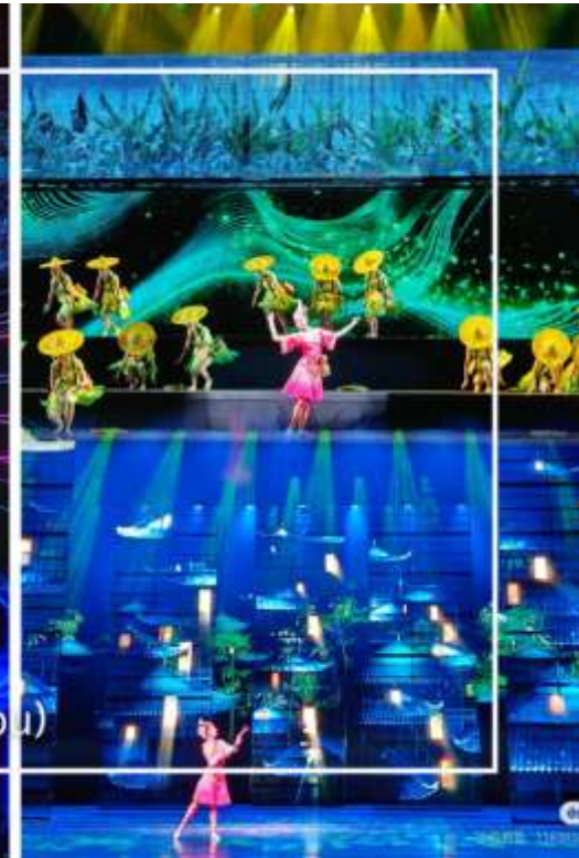
การแสดงโชว์ซีลิ่งคาปู (Xilan Kapu)

เดินทางเข้าโรงแรมที่พัก Xiazhou Hotel ระดับ 4 ดาวหรือเทียบเท่า