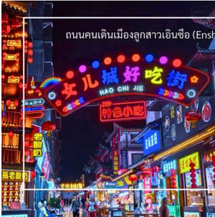
ถนนคนเดินเมืองลูกสาวเินซือ (Enshi Daughter City Pedestrian Street)