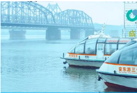
ล่องเรือแม่น้ำยาลู่เจียง

หลังอาหารให้ท่านพักผ่อนตามอัชชาศัยในโรงแรม