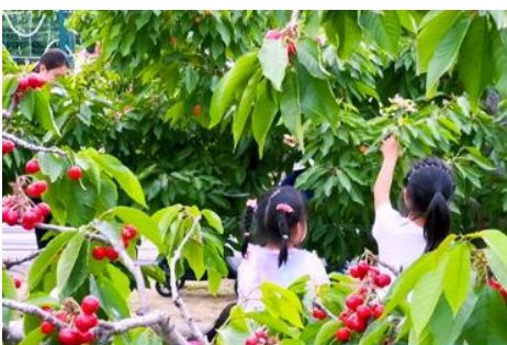
สวนเชอร์รี่