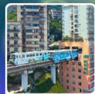
รถไฟฟ้า-ลุดติก