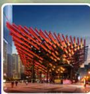
พิพิธภัณฑ์ศิลปะ-ตะเกียบ