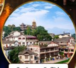
เมืองโบราณฉือจี้โข่ว