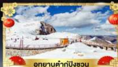
อุทยานคำกู่ปิงชวน