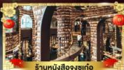
ร้านหนังสือจงซูเก๋อ