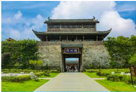
เมืองโบราณฮุยโจว