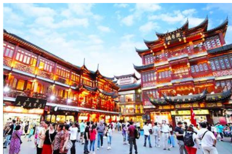
ตลาดเจิงหวงเมี่ยว

เช้า รับประทานอาหารเช้า ณ ห้องอาหารของโรงแรม (6)