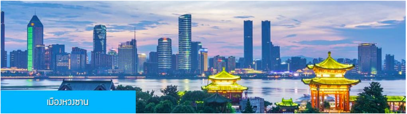
เมืองหางซาง