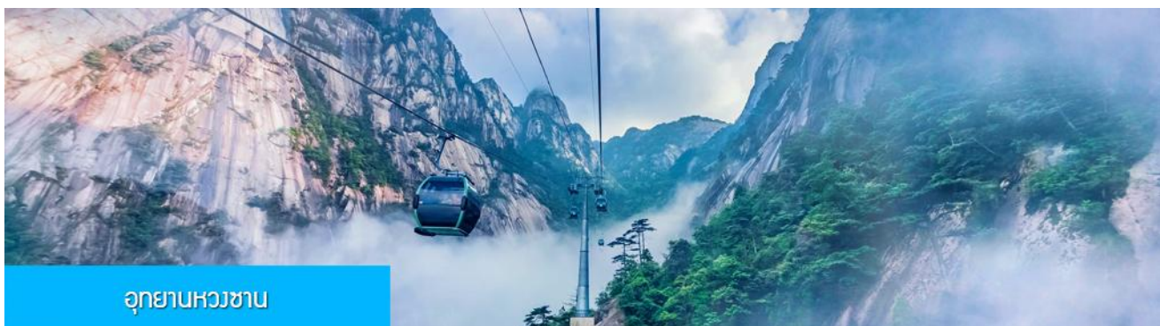
อุทยานหวงซาน