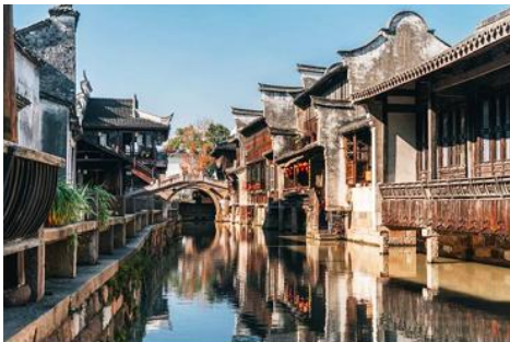
เมืองโบราณวูเจิน