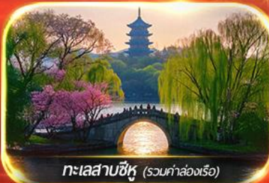
ทะเลสาบซีหู (รวมค่าล่องเรือ)