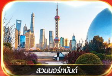
สวนนอร์มันด์