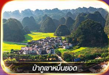
ป่าภูเขาหมื่นยอด