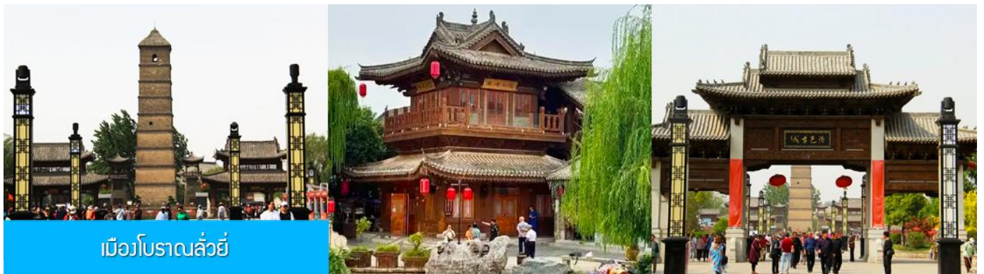
เมืองโบราณฉั่วหยี่

16.18 น. ขบวนรถไฟนำคณะเดินทางถึงสถานีรถไฟนครฉั่วหยาง นำคณะขึ้นรถบัสเพื่อเดินทางสู่ นครฉั่วหยาง