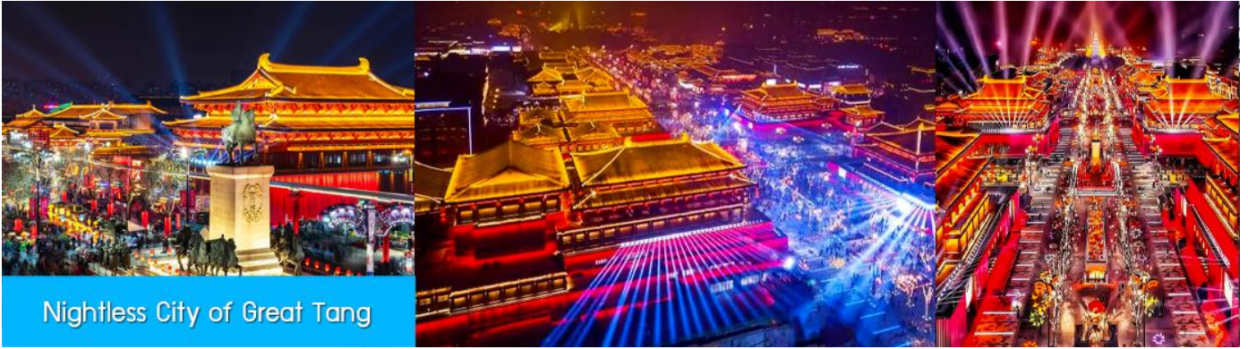
Nightless City of Great Tang

หลังอาหารนำท่านเที่ยวชม Nightless City of Great Tang สถานที่ท่องเที่ยวกลางแจ้งที่สร้างจำลองบรรยากาศย้อนยุคสมัยราชวงศ์ถังที่สุดอลังการ ท่ามกลางแสง สี และ โคมไฟที่ประดับอย่างสวยงามตระการตา เป็นที่เชื่อกัน ถ่ายภาพยอดเยี่ยมแห่งใหม่ของนครซีอาน พักที่ HOLIDAY INN EXPRESS HOTEL โรงแรมระดับ 4 ดาวท้องถิ่นในนครซีอาน