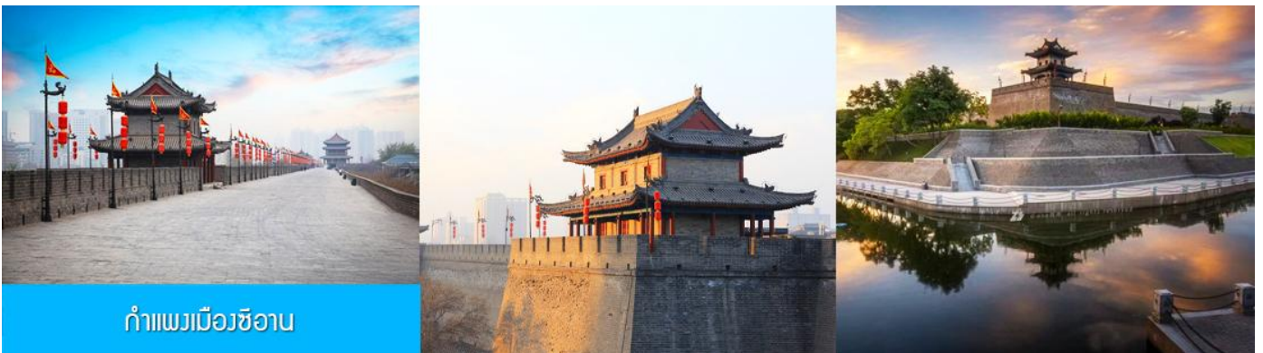
กำแพงเมืองซีอาน

หลังอาหารนำท่านนั่งรถบัสผ่านชม กำแพงเมืองโบราณ 西安古城墙 (เป็นการนั่งรถผ่านชมด้านนอก เนื่องจากค่าทัวร์ไม่ได้รวมค่าบัตรเข้าชมด้านใน ) กำแพงเมืองเก่าแก่ที่สร้างขึ้นในสมัยราชวงศ์หมิง อายุกว่า 600 ปี ตัวกำแพงมีฐานกว้าง 18 เมตร มีความสูง 12 เมตร ความยาวโดยรอบ 11.9 กิโลเมตร เป็นกำแพงเก่าแก่ที่ยังคงสภาพสมบูรณ์ที่สุดของจีน และเป็นโบราณสถานขึ้นชื่อของเมืองซีอาน