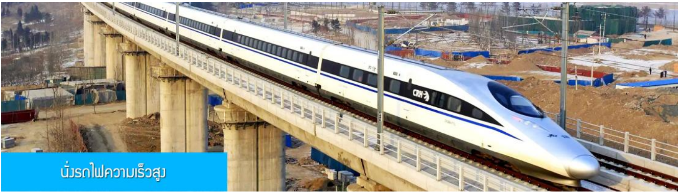
บริการรถไฟความเร็วสูง

หลังอาหารนำท่านเดินทางสู่สถานีรถไฟความเร็วสูงนครซีอาน เพื่อเตรียมเดินทางสู่นครฉั่วหยาง