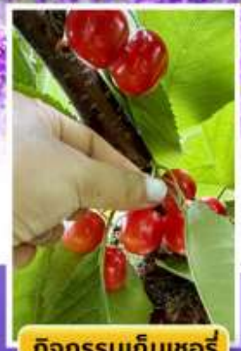
กิจกรรมเก็บเชอร์รี่

🍷 ออนเซ็น 2 คืน 🧳 นน.กระเป๋า 23 กก. 1 ใบ ☀️ 6Days 4Night