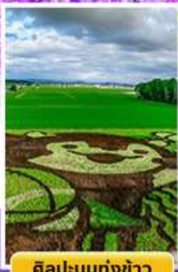
ศิลปะบนทุ่งข้าว