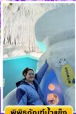
พิพิธภัณฑ์น้ำแข็ง