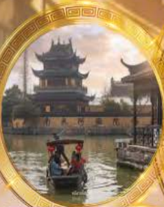
หมู่บ้านโบราณจูเจียเจี้ยว

บินหรู Full service พัก 5 ดาวย่านช้อปปิ้ง