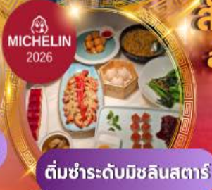
ติมชำระระดับมิชลินสตาร์

สัมผัสทัศนียภาพเซี่ยงไฮ้ เช็กอินแลนด์มาร์คล้ำยุค ล่องเรือเมืองเก่าจูเจียเจี้ยว พักหรู 5 ดาว ครบจบในทริปเดียว