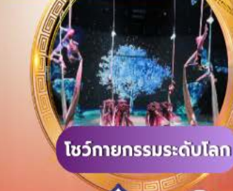
โชว์กายกรรมระดับโลก