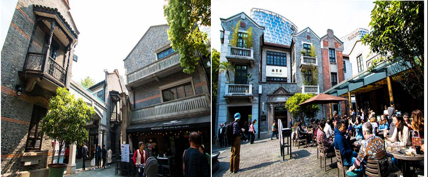
ค้ำ บริการอาหารค้ำ ณ ร้านอาหาร TAOTAOJU [มือที่ 7] เมนู ต้มซ่าเจ้าดัง

นำท่านเที่ยวชม ซินเทียนตี้ ย่านฮิปเตอร์ใจกลางนครเซี่ยงไฮ้ ที่วัยรุ่นต้องมา กลายเป็นสถานที่ท่องเที่ยวติดอันดับต้นๆไปแล้ว สำหรับแหล่งช้อปปิ้งแห่งนี้ ไม่แพ้แหล่งช้อปปิ้งรุ่นพี่ อย่าง ถนนนานกิง ถนนอูเจียง Yu Yuan Bazaar ถือว่าเป็นอีก 1 ไฮไลท์เด็ดของนครแห่งนี้ เนื่องจากเอกลักษณ์ที่ไม่เหมือนใคร สิ่งปลูกสร้างที่ใช้อิฐบล็อกแบบสถาปัตยกรรมแบบ Shikumen (ซิกเหมิน) การผสมผสานระหว่างสถาปัตยกรรมตะวันตกกับจีนเข้าด้วยกัน ทางเดินหิน กำแพงหิน ประตูหิน บ้านเมืองเก่าแต่ดูแลรักษาอย่างดี