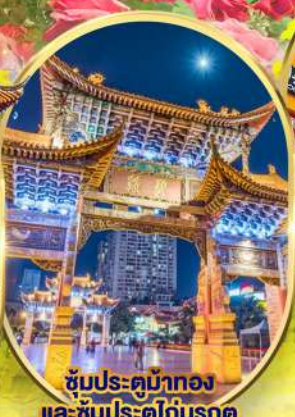
ซุ้มประตูม้าทอง และ ซุ้มประตูโก๋มรกต