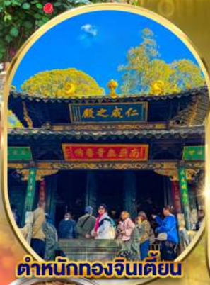
ตำหนักทองจินเตียน