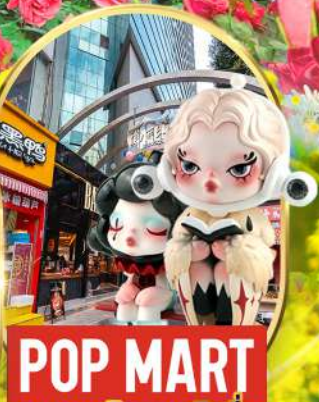
POP MART ถนนคนเดินหนานผิงเจีย