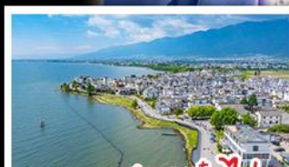
ทะเลสาบเอ๋อไห่