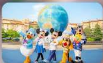
อิสระตามอียาสัย 2 วัน