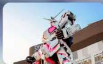
ช้อปปิงโอไดบะ