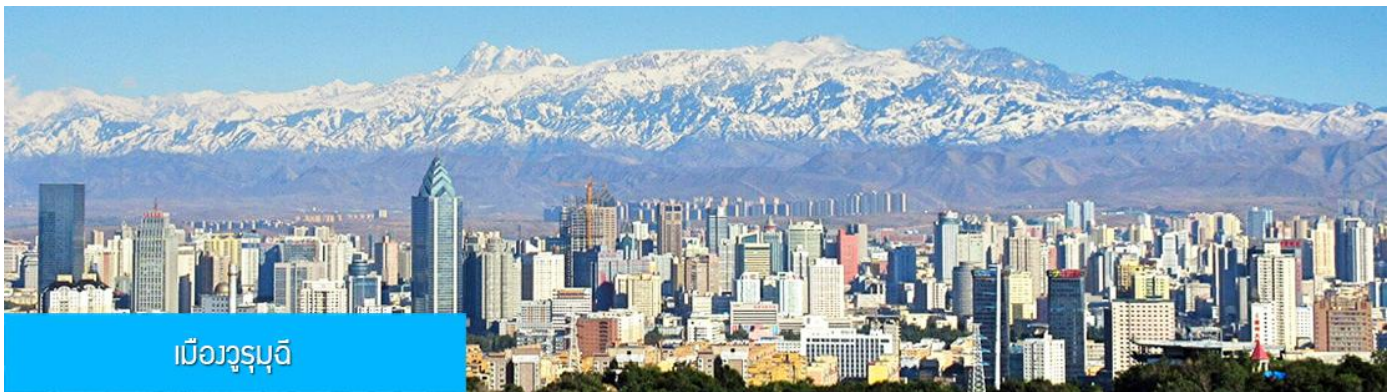
เมืองวุรูมูฉี