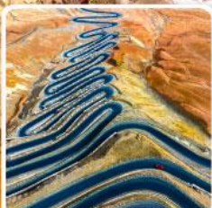
ถนนผานหลงกู่ต้าว