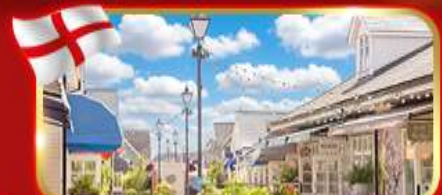
ช้อปปิ้งเอาท์เล็ต Bicester village